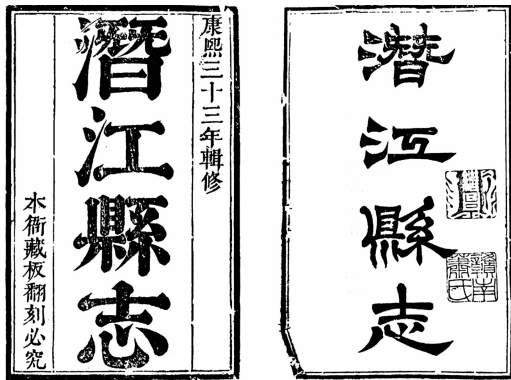
图1 原刊本（左）和重刊本（右）的书名页

刻本亦称刊本、槧本、镌本，指雕版印刷而成的书本。 ① 康熙《潜江县志》的刻本有两个，一是康熙三十三年（1694）传经书院刻本，为原刊本，二是光绪五年（1879）传经书院刻本，为重刊本（见图1） ② 。故宫博物院把院藏的《潜江县志》作为原刊本收入《故宫珍本丛刊》史部地理类都会郡县之属，2001年由海南出版社出版（后文简称为“故宫本”）。故宫本在丛书《卷首》的分册总目录里介绍本书：“〔康熙〕潜江县志二十卷首一卷，清刘焕修，朱载震纂，清康熙三十三年刻本。” ③ 但故宫本在表现形式上与原刊本有很大的不同，与通常的刻本也有较大差异，本文试就此比较分析，并对故宫本和两个刻本的关系进行探讨。