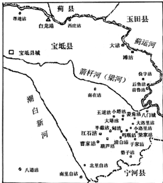
图3 宝坻县的沽村落

因，也有军事、经济原因。其一，金统一北方后，迁都燕京（今北京）定为中都。为改善通向中都的漕河运输，金章宗于泰和五年（1205）改凿运渠，河北、河南、山东一带的漕粮等物资经南运河、大清河，再经过三汉口转运至中都。经三汉口运往中都的漕粮每年多达170万石以上，因此三汉口成为通往京都的重要漕运枢纽。其二，当时河北一带的乱军起义对金朝统治影响甚大，《金史》中相关记载证实了乱军对金政权的威胁。因此，金廷为维护漕运水路安全及该地有效统治，在三汉口建立军事据点直沽寨，犹如“七十二沽”村落群的一粒种子，是为肇始。