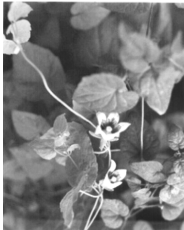
图6 《中华人民共和国药典中药彩色图集》(1990年版)植物党参图

至此，桔梗科党参出现的大致时间和原因、原产地、如何得名“党参”、与五加科上党人参的关系、清人对其的使用情况和基本看法等问题已经全部厘清。而乾隆《潞安府志》中将上党人参附在党参之下，也符合二种皆出此地的史实，需要指出的是，山西省的《山西通志》《潞安府志》《壶关县志》等清代地方志中，从未将五加科上党人参和桔梗科党参混淆，也未出现过将“上党人参”“上党参”“党参”混同皆指桔梗科党参的情况。