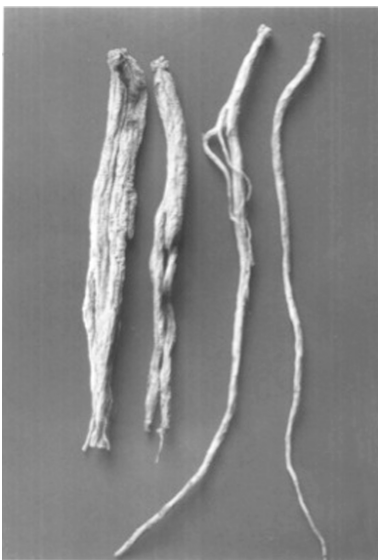
图7 《中华人民共和国药典中药彩色图集》(1990年版) 药材党参图

毛祥麟所著《对山医话》说：“人参在古《本草》云：‘生上党山谷及辽东，形长而色黄，状如防风。’产百济者，形细而坚白，气味薄于上党，此皆言党参也。濒湖李氏辑《本草纲目》广搜诸品，而未及于参，至我朝漱水吴氏，订《从新》一书，如分人参、党参为两种，知明时尚无人参。” ① 认为清以前本草中以“上党人参”为代表的古代人参皆是桔梗科党参，五加科人参不过是“国初始见用，其名乃著于时” ② 。1921年，谢观的《中国医学大辞典》：“古方人参即今太行山脉之党参，至于长白山脉之参，金元以来，方渐用之。” ③ 1924年，张锡纯的《医学衷中参西录》：“人参之种类不一，古所用之人参，方书皆谓出于上党，即今之党参是也。考《神农本草经》载，人参味甘，未尝言苦，今党参味甘，辽人参则甘而微苦，古之人参其为今之党参无疑也。” ④ “生于潞州太行紫团山者名潞党参，亦名紫团参。” ⑤ 1927年，曹炳章增补的《增订伪药条辨》按语：“前贤所谓人参，产上党郡，即今党参也，考上党郡，即今山西长子县境，旧属潞安府，故又称潞党参。” ⑥ 此四种著作在近代都比较畅行，致使“上党人参”是桔梗科党参的观念延续至1949年以后，并在上海中药界产生过重要影响：“中国药学会上海分会和上海市药材公司经组织富有实践经验的老药工进行数十次坐谈、整理、总结而成的《药材资料汇编》上集于1959年出版，书中在党参名下专讲了党参命名的由来：‘古时所称人参就是党参，党参最早产地是现在的山西长治，该产地在秦时为上党郡，故名党参。隋时改为潞州，故称潞党参。’这