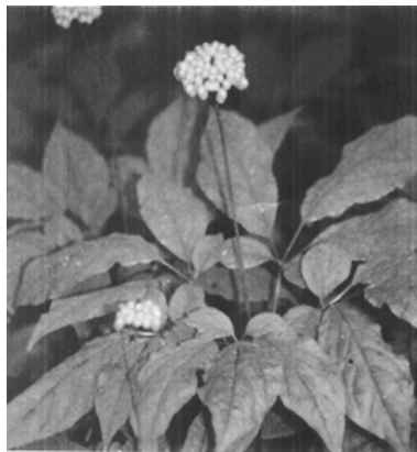
图3 《中华人民共和国药典中药彩色图集》(1990年版)植物人参图

《植物古汉名图考》将“上党人参”释作桔梗科党参的主要原因是，其中所引清代本草《本经逢原》中内容与今对桔梗科党参的描述相一致 ① 。那么缘何《本经逢原》中的“上党人参”给出了与桔梗科党参性味功效相符的描述？乾隆《潞安府志》又为何要将有关上党人参的内容大段附在“党参”之下？通过考察清代多家本草著作中对桔梗科党参的记载，发现“上党人参”“上党参”在清代一般多指桔梗科党参，而且“党参”与五加科上党人参其实渊源颇深，桔梗科党参的出现、命名皆与上党人参有关。