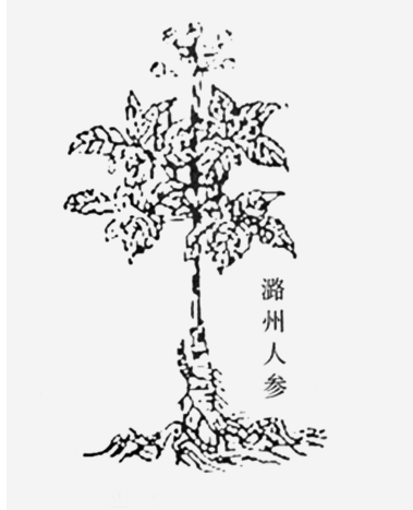
图2 《本草图经》潞州人参图

后，我国曾在山西中条山成功引种过人参，一般认为这次实验结果能够证明山西地区的自然条件是适合人参生长的。